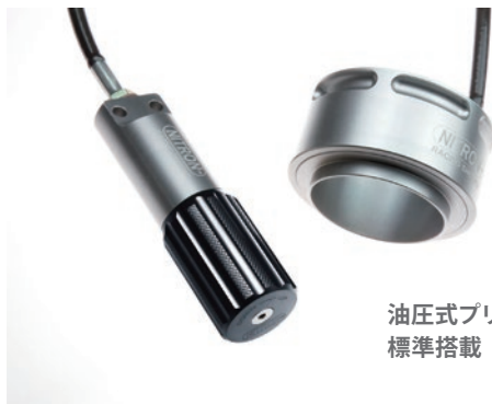
油圧式プリロードアジャスターを 標準搭載

全てのモデルで "TITANIUM BLACK SPRING" をセレクトできます。