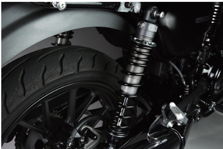
Fitting Image (HONDA GB350 /NITRON TITANIUM TWIN R1 Series)