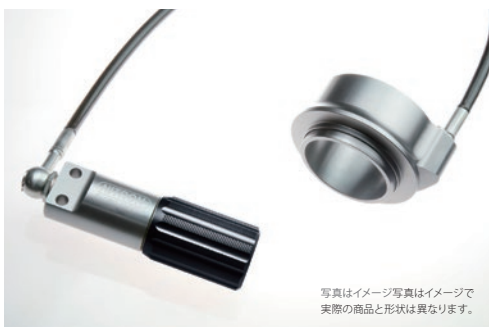
油圧式 プリロードアジャスター 標準装備モデル

詳しくは NITRON ホームページをご覧ください >>> www.nitron.jp