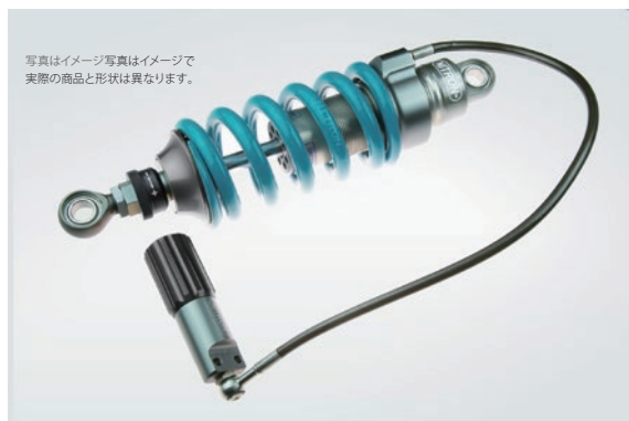
R1 Series 標準価格 ¥137,500 (税込) NTBKS67S-TQ 1wayダンピングアジャスター搭載 / 内蔵リザーバタンクモデル 油圧式プリロードアジャスター標準装備モデル