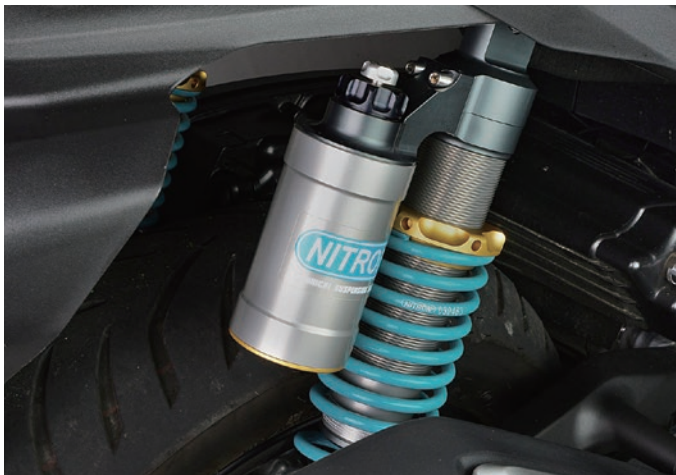
Fitting Image (NITRON GOLD TWIN R3 Series Turquoise Spring)