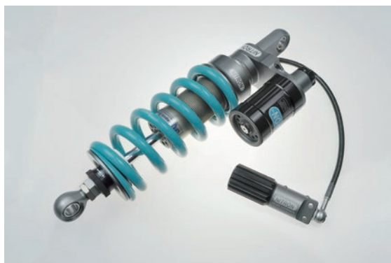
R2 Series 標準価格 ¥174,900 (税込) NTBKKT04T-TQ 2way ダンピングアジャスター搭載 / 別体リザーバタンクモデル 油圧式プリロードアジャスター標準装備モデル