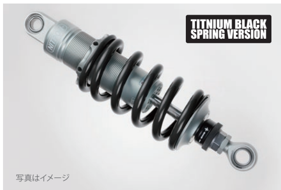
R1 Series 標準価格 ¥104,500 (税込) NTBKKT04S-TB 1way ダンピングアジャスター搭載 / 内蔵リザーバタンクモデル