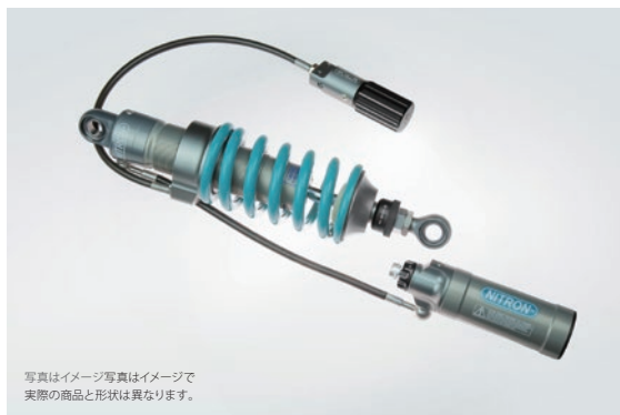
R3 Series 標準価格 ¥199,100 (税込) NTBKY78R-TQ 3way ダンピングアジャスター搭載 / 別体リザーバタンクモデル 油圧式プリロードアジャスター / 専用ブラケット標準装備モデル