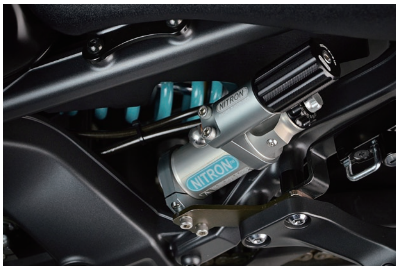
Fitting Image (R3 Series)