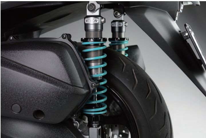
Fitting Image (NITRON BLACK TWIN R1 Series)