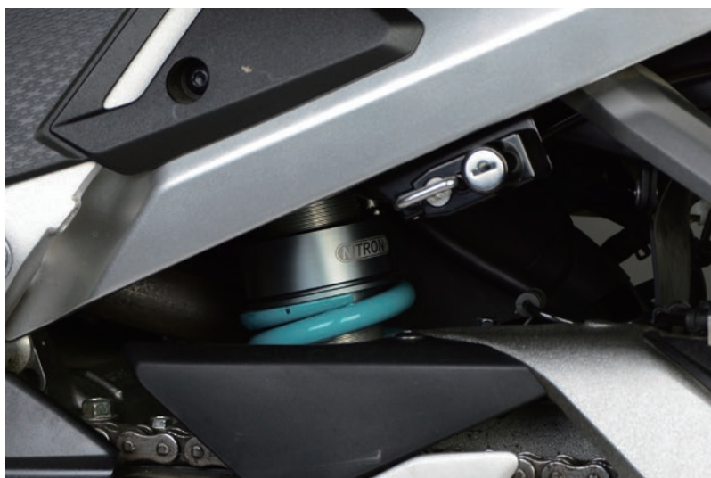
Fitting Image (R1 Series)

R3 Series 標準価格 ¥181,000 NTBKH78R-TQ 3way ダンピングアジャスター搭載 / 別体リザーバタンクモデル 油圧式プリロードアジャスター / 専用ブラケット標準装備モデル