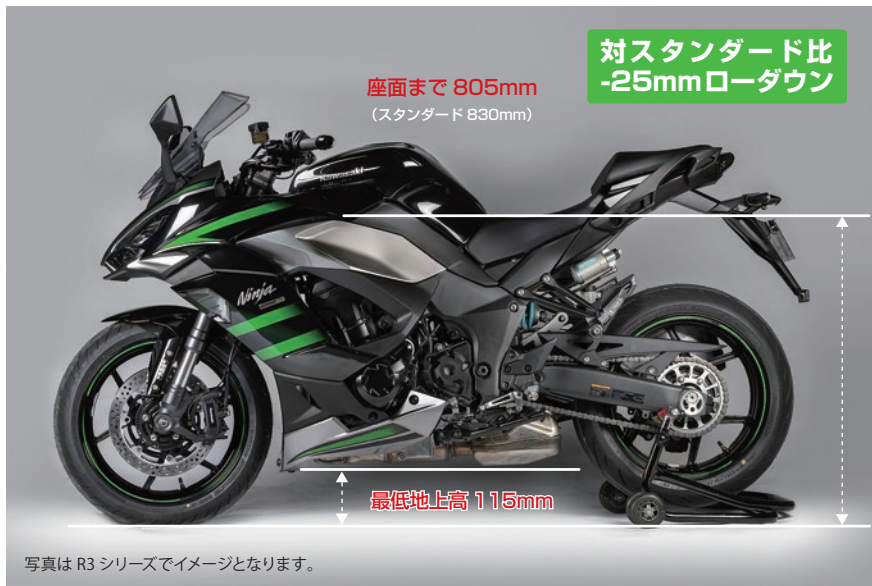
写真はR3シリーズでイメージとなります。

また、これまでのターコイズスプリングに加えてタイタニウムブラックスプリングもセレクトできます。