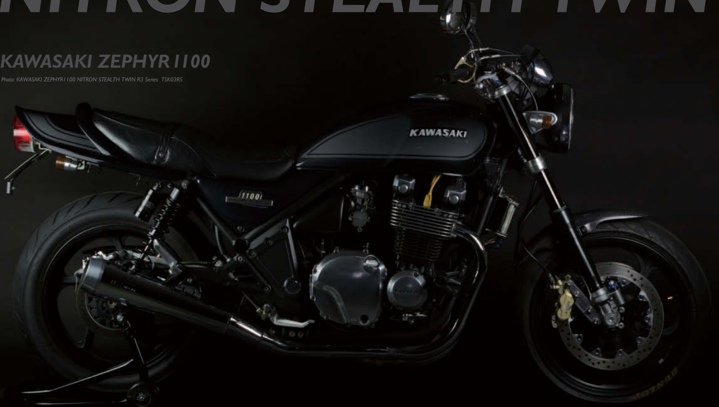
Photo: KAWASAKI ZEPHYR 1100 NITRON STEALTH TWIN R3 Series TSK03RS