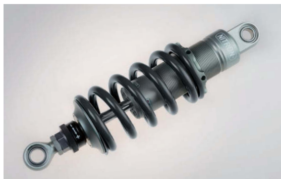
NITRON MONO Shock R1 シリーズ Titanium Black Spring Version

対応可能ショックは、NITRON MONO ショック RACE PRO シリーズ、R3 シリーズ、R2 シリーズ、R1 シリーズになります。(NITRON MINI ショックは非対応) タイタニウムブラックスプリング対応は2016年11月1日受注分より受付となりますが、スプリングのサイズによってはデリバリーにお時間を頂く場合もあります。タイタニウムブラックスプリングをご要望の場合は対応状況をナイトロンジャパンへお問い合わせください。