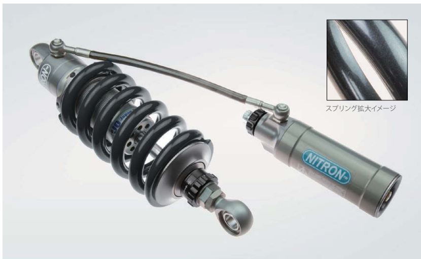
スプリング拡大イメージ

NITRON テーマカラーのターコイズスプリングもこれまで同様セレクトできます。