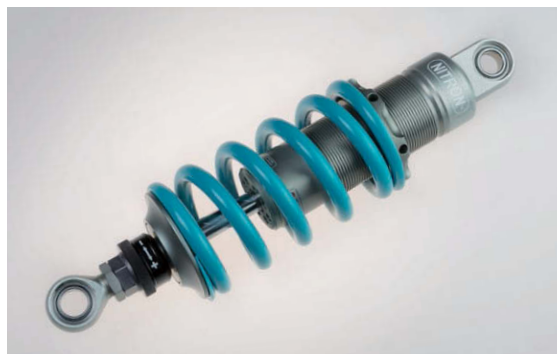
NITRON MONO Shock R1 シリーズ Turquoise Spring Version

NITRON テーマカラーのターコイズスプリングもこれまで同様セレクトできます。