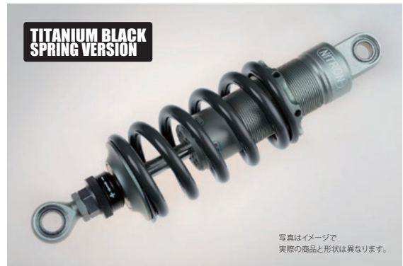
写真はイメージで 実際の商品と形状は異なります。

R1 Series ¥130,900 (税抜 ¥119,000) NTBKW73S-TQ/TB