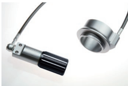
油圧式 プリロードアジャスター 標準装備モデル (R1 シリーズはオプション)

詳しくは NITRON ホームページをご覧ください >>> www.nitron.jp