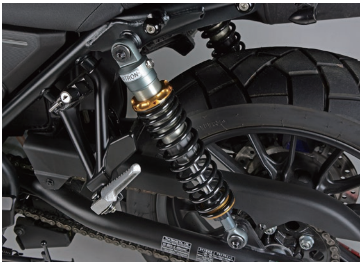
Fitting Image (NITRON GOLD TWIN R1 Series)

(3タイプのカラーバリエーションにブラック又はターコイズのスプリングの組み合わせが可能です。 詳しくは NITRON WEB ページをご覧ください。)