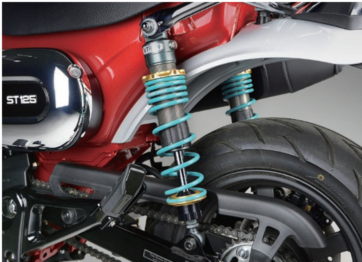
Fitting Image (NITRON GOLD TWIN R1 Series)