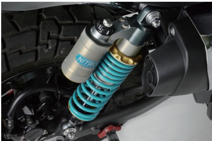
Fitting Image (HONDA Monkey125 ’21- /NITRON TWIN Shock R3 Series)