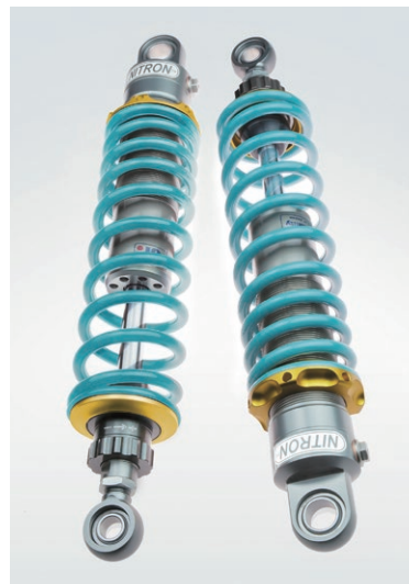
写真はイメージで 実際の商品と形状は異なります。