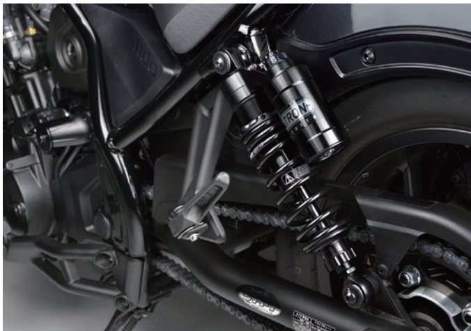
Fitting Image (NITRON STEALTH TWIN R3 Series)