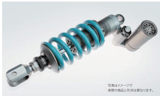
写真はイメージで 実際の商品と形状は異なります。

R3 Series ¥174,900 (税抜 ¥159,000) NTBKK18R-TQ/TB 3way ダンピングアジャスター搭載 / 別体リザーバタンクモデル / 車高調整アジャスター 油圧式プリロードアジャスター (HPA) はオプション