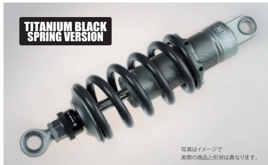
写真はイメージで 実際の商品と形状は異なります。

R1 Series ¥130,900 (税抜 ¥119,000) NTBKK18S-TQ/TB 1way ダンピングアジャスター搭載 / 内蔵リザーバタンクモデル / 車高調整アジャスター 油圧式プリロードアジャスター (HPA) はオプション