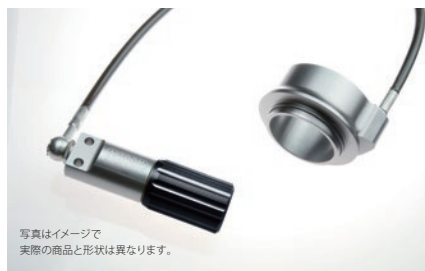
写真はイメージで 実際の商品と形状は異なります。

R1 Series ¥130,900 (税抜 ¥119,000) NTBKK18S-TQ/TB 1way ダンピングアジャスター搭載 / 内蔵リザーバタンクモデル / 車高調整アジャスター 油圧式プリロードアジャスター (HPA) はオプション