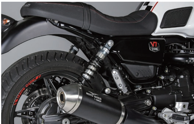
Fitting Image (V7 Stone TWIN R1 Series)