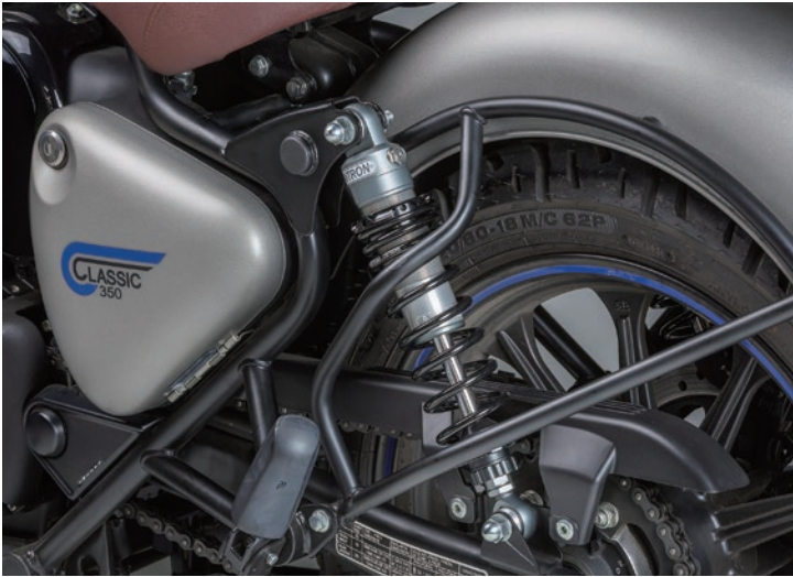
Fitting Image (NITRON BLACK TWIN R1 Series)

(3タイプのカラーバリエーションにブラック又はターコイズのスプリングの組み合わせが可能です。 詳しくは NITRON WEB ページをご覧ください。)