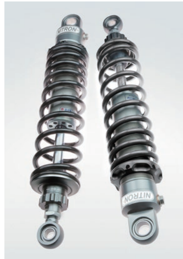
写真はイメージで 実際の商品と形状は異なります。