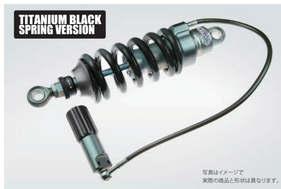
R1 Series ¥178,200 (税抜¥162,000) NTBKS70S-TQ/TB 1way ダンピングアジャスター搭載 / 内蔵リザーバタンクモデル 油圧式プリロードアジャスター標準装備モデル / 車高調整アジャスターは付属していません