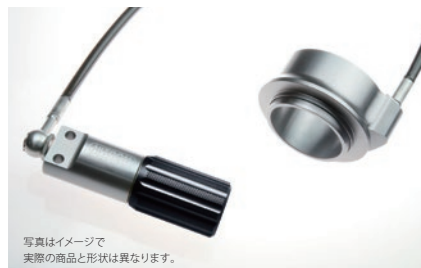
油圧式プリロードアジャスター標準装備モデル

詳しくは NITRON ホームページをご覧ください >>> www.nitron.jp