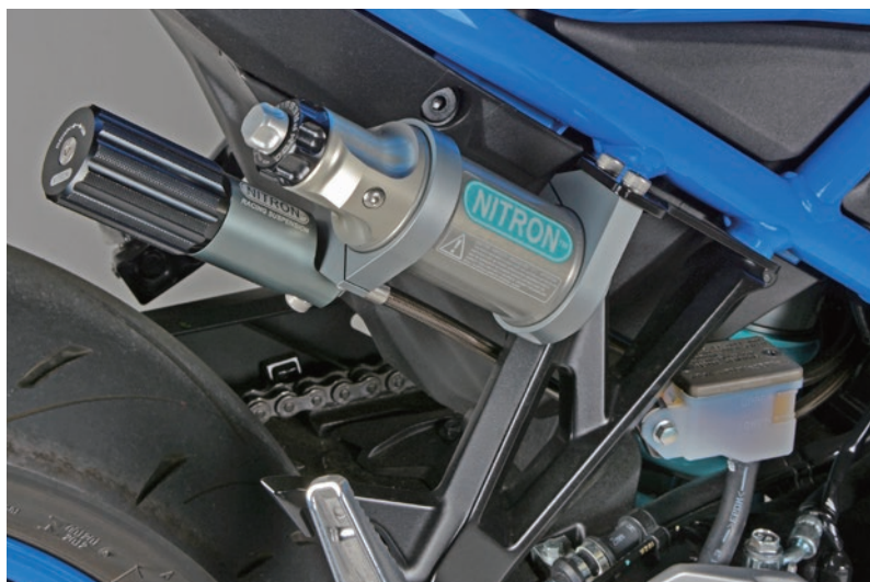
Fitting Image (R3 Series)