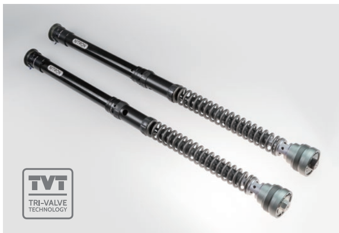
NTR TVT ¥242,000 (税抜 ¥220,000) / 組込工賃別 品番：NTFK25HO21B