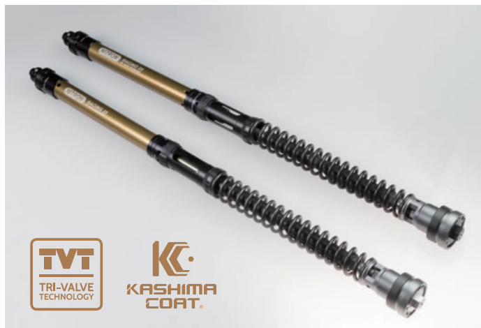
NTR TVT PRO ¥275,000 (税抜 ¥250,000) / 組込工賃別 品番：NTFK25HO21K